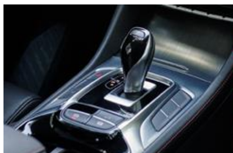
7-stupanjski automatski DCT mjenjač kao opcija na Comfort i Luxury