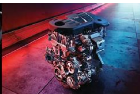
Snažan motor 1.5T GDI s izravnim ubrizgavanjem goriva osigurava snagu od 162 KS